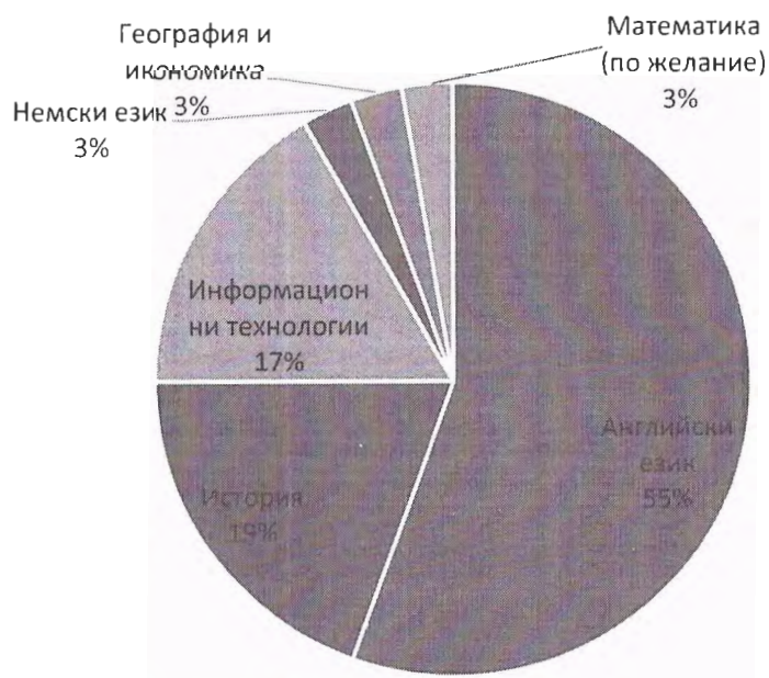
ДЗИ - втори задължителен. Брой явили се.

Единадесет от зрелостниците не се дипломират.